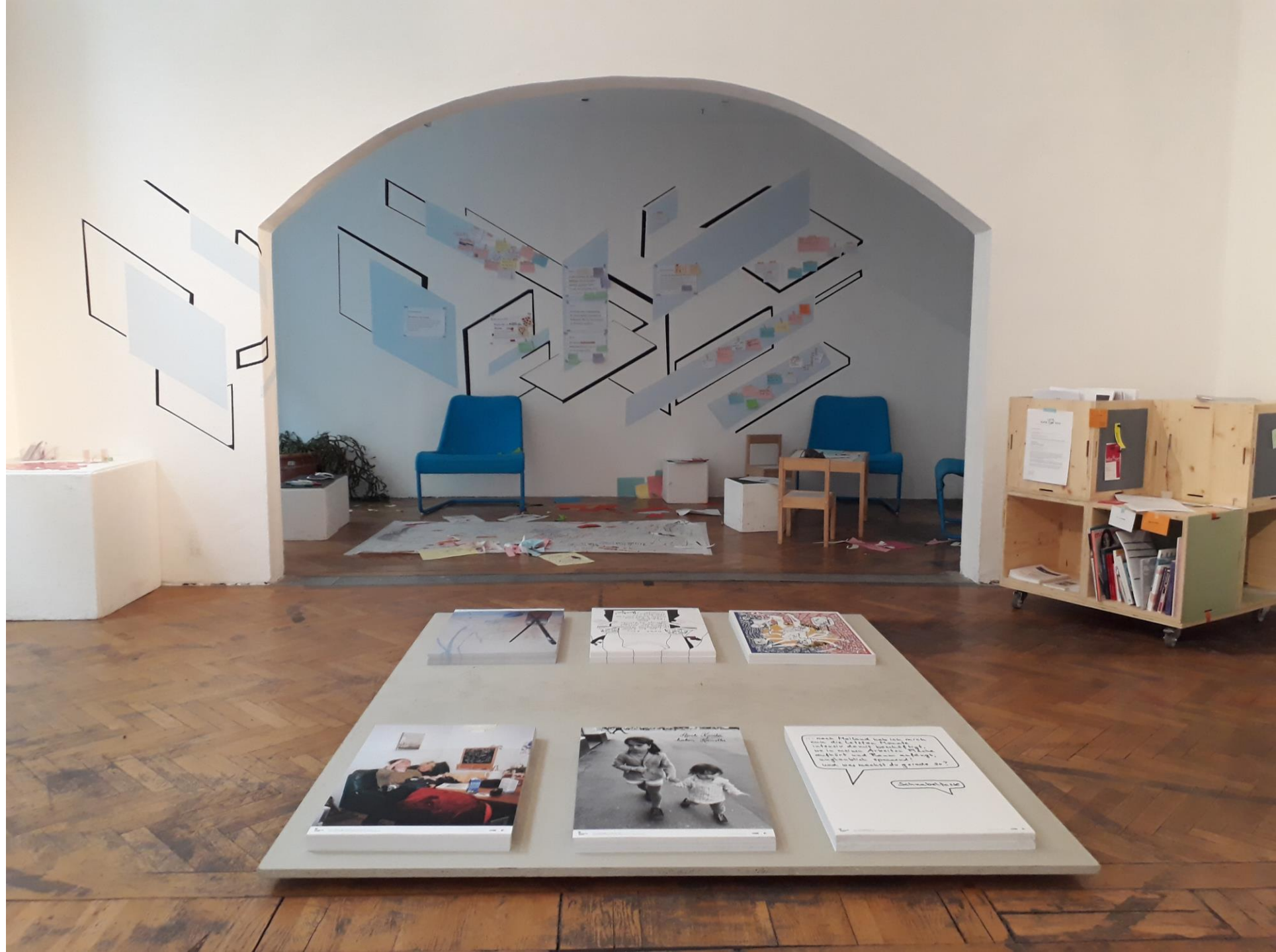
Kunst & Kind: Plakate! Ausstellung IG Bildende Kunst Wien 28.6.-28.7.2017